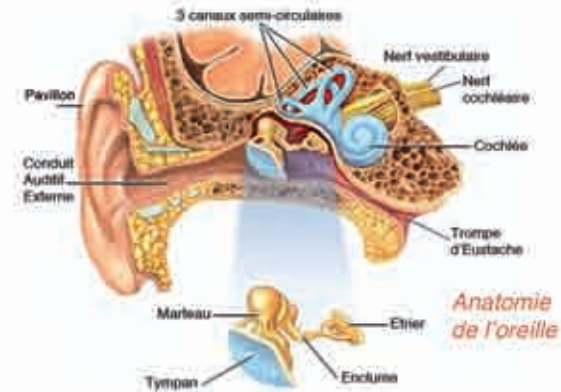
Anatomie de l'oreille

L'organe de Corti contient plusieurs milliers de cellules ciliées internes (environ 3000) et externes (environ 10000). Chaque cellule ciliée est recouverte d'environ 100 cils (stéréocils). Les fibres du nerf auditif proviennent des cellules ciliées internes. Le vestibule rempli de liquides labyrinthiques, contient deux vésicules, l'utricle et le saccule, à partir desquelles naissent des fibres du nerf de l'équilibre, le nerf vestibulaire qui chemine aux côtés du nerf auditif, à l'intérieur du conduit auditif interne. Les canaux semi-circulaires sont au nombre de trois : supérieur, horizontal et postérieur. Ils baignent dans les liquides labyrinthiques et donnent naissance également à des fibres du nerf vestibulaire.