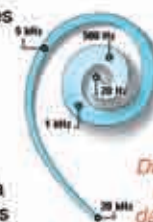
Distribution des fréquences dans la cochlée

Chaque fréquence sonore est perçue à un endroit différent et spécifique de la cochlée. Les fréquences les plus aiguës sont perçues au tout début et les fréquences les plus graves au fond.