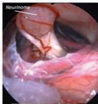
Vue opératoire sous endoscope montrant le neurinome

■ Chirurgie: Le choix de la technique chirurgicale (voie d'abord) dépend de la taille de la tumeur et de l'importance de la surdité. La résection complète de la tumeur sans séquelle neurologique et avec conservation de l'audition est le but ultime de la chirurgie mais le plus souvent l'audition ne peut être préservée.